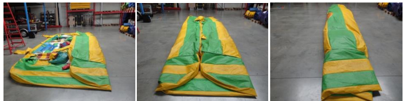
Dichtvouwen in 3 keer