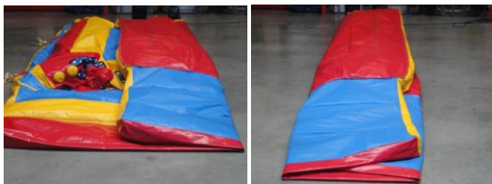
Dichtvouwen in 2 keer

4x5 meter: max.10 personen 5x6 meter: max.14 personen