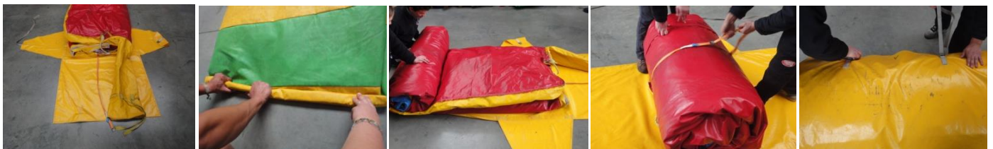
Spanriem + hoos klaarleggen - Rollen naar de richting van de uitlaatpijpen (A) - spanriem vastmaken rond het pakket + inpakken in hoos