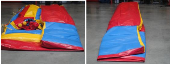
Dichtvouwen in 2 keer