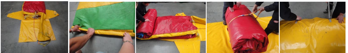
Spanriem + hoes klaarleggen - Rollen naar de richting van de uitlaatpijpen (A) - spanriem vastmaken rond het pakket + inpakken in hoes