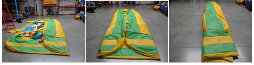
Dichtvouwen in 3 keer