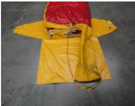
Spanriem + hoes klaarleggen