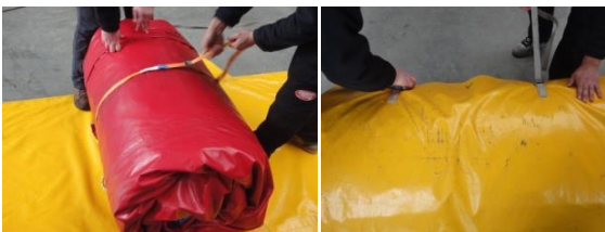
spanriem vastmaken rond het pakket + inpakken in hoes