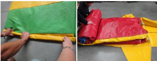
Rollen naar de richting van de uitlaatpijpen